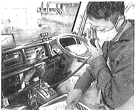
「類塾」は送迎バスに無線機を備える。運転手が教室側と、バスに乗る子どもらを確認している=10日、大阪府吹田市

静岡県牧之原市の認定こども園のバスで、置き去りにされた女兒(当時3)が亡くなった事件から約2カ月。全国の保育施設などでは国の働きかけもあって、送迎バスの安全対策が進みつつあります。一方で、子どもが利用することの多いスポーツクラブや塾などの送迎バスの場合、対応は事業者任せに委ねられています。取り組みに温度差が出かねない現状といえそうです。